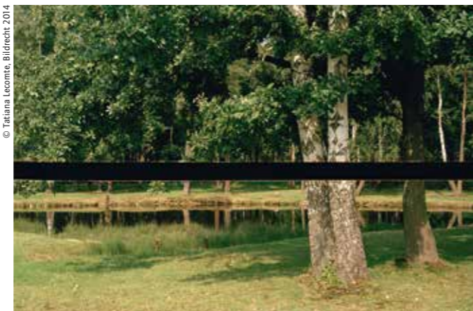
Tatiana Lecomte, Der Teich | The Pond, 2005, C-Print, 110 x 146 cm