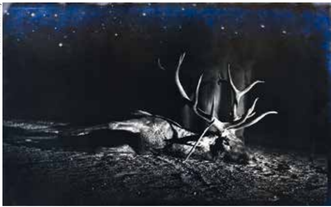
Marcell Esterházy, The End of the Long March, 2011, Foto | photo, Diasec