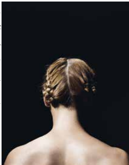
Andreas Mühe, Betty, 2012, aus der Serie | from the series „Obersalzberg“, C-Print, 140 x 110 cm, Edition: 5 + 3 AP / 12,7 x 10,16 cm, Edition: 7 + 3 AP