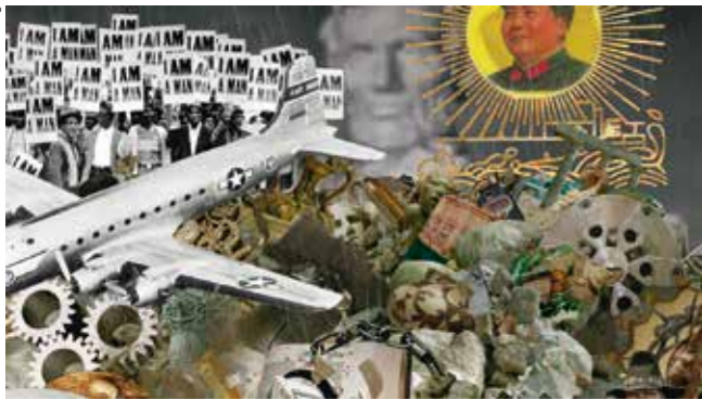
Aura Rosenberg, The Angel of History, 2009-13, Video, 5:00 min