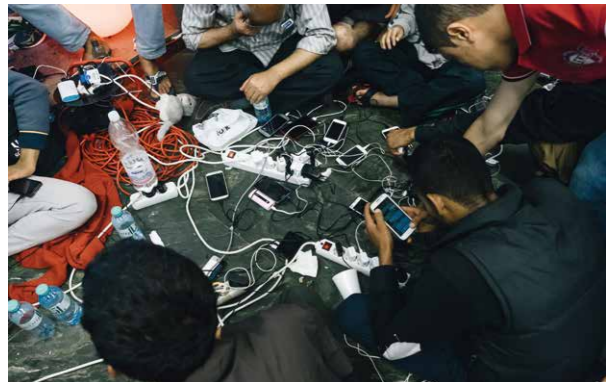
Florian Rainer, Fluchtwege | Escapes , 2015, Farbfoto, Pigmentprint | colour photograph, pigment print

„Looking for the Clouds“ spannt zeitlich und thematisch einen Bogen vom 11. September 2001 mit seinen tragischen Ereignissen in New York bis herauf in das Jahr 2015, das sich uns allen als Höhepunkt einer beispielelosen, erzwungenen, enormen Migration eingeprägt hat. Die Ausstellung stellt Foto- und Videoarbeiten internationaler KünstlerInnen und FotojournalistInnen vor, um die Geschichte der letzten 15 Jahre unter diesem Aspekt zu beleuchten. Dabei war 9/11 nur der Ausgangspunkt für einen tiefgreifenden strukturellen Wandel, den unsere Gesellschaft seither erlebt und der uns extremen Situationen, die einander bedingen, aussetzt: Eine nahezu komplette Überwachung des öffentlichen und privaten Raumes, kriegsbedingte Flucht nach und innerhalb Europas sowie eine nachhaltige Definitionsverschiebung des Begriffs „Identität“ stellen althergebrachte Lebensmuster langfristig in Frage.