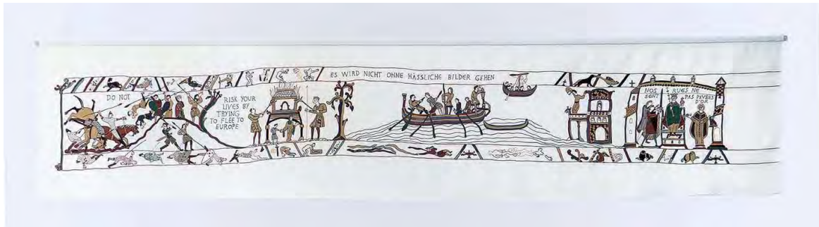
Bayeux 2.0 2017 290 x 65 cm Embroidery, Wool on linen https://www.boukal.at/en/gallery-e.html/bayeux-2.0/

We took advantage of her upcoming participation in an Italian project to interview her and learn more about her journey. And here is what she told us.