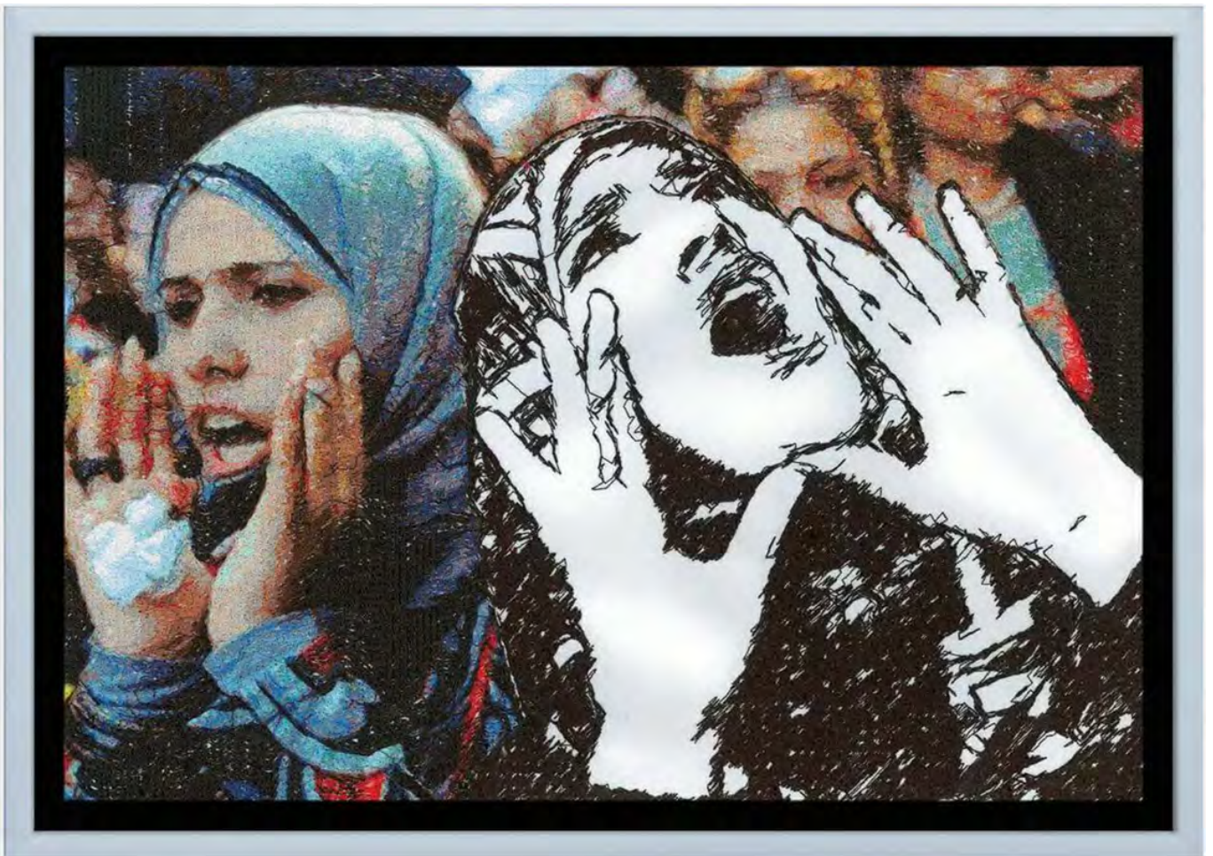
Unfinished 2012–2013 75 pieces, 21 x 30 cm each Embroidery on Canvas https://www.boukal.at/en/gallery-e.html/unfinished/