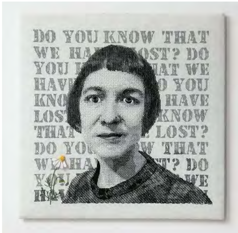
Do you know that we have lost? 2019 50 x 50 x 4,5 cm Blackwork and Stumpwork on fabric https://www.boukal.at/en/gallery-e.html/do-you-know-that-we-have-lost/