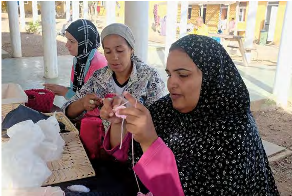
Workshop in Melilla