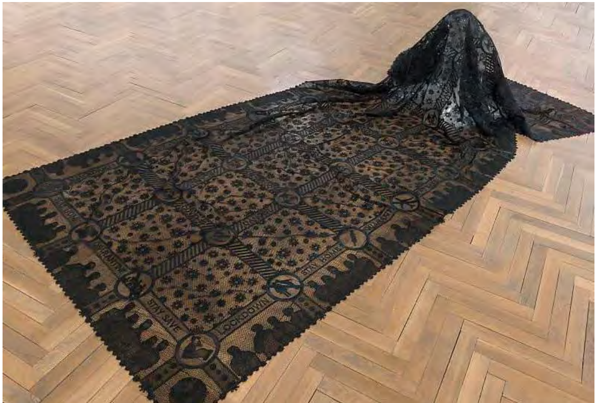
Requiem 2021 135 cm x approx. 340 cm Freestanding Lace (Viscose), doll (PVC) https://www.boukal.at/en/gallery-e.html/requiem/