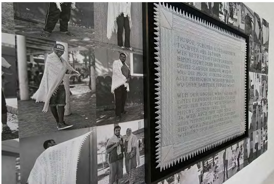
Ode to Joy 2014 Hand-knitted plaid, 150 x 190 cm, 44 posters, 30 x 45 cm each Cashmere-wool, Paper https://www.boukal.at/en/gallery-e.html/ode-to-joy/

Your work turns the spotlight on small anonymous stories that are common to many people and to many lives, giving voice and shape to everyday heroism by transforming personal experience into universal. How are your works born? What are the areas of interest of your research? How do ideas take shape?