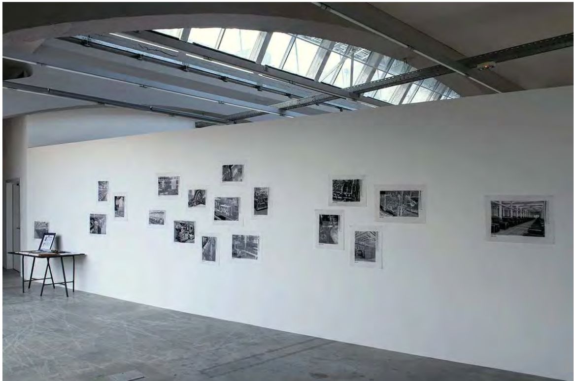
Broder La Machine 2019 - 2020 Various sizes Tapestry embroidery https://www.boukal.at/en/gallery-e.html/broder-la-machine/

Alongside the artistic path you also have the didactic, laboratory and editorial professions. How important is the relationship with other people, communicating and transmitting ideas, reflections, skills, etc.?